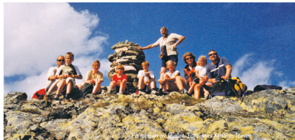
På toppen av Ilfjellet.

Følg veien fra parkeringsplassen til fots i retning Meslosætra. Stien til Ilfjellet tar av til venstre om lag 700 meter etter bommen. Følg stien ned til elva Ila. Her heter det Herremsvaet. Følg elva til Ilfossen og fortsett på venstre side forbi ei bakkemyr. Kryss elva. Til venstre for deg har du Iltjønnin som er gode fiskevatn. Fortsett opp bakkene i retning mot nordøst forbi en liten bekkedal og gjennom den frodig fjelldalen Fagerlibygda. Det kommer to bekker ned gjennom dalen. Gå på høyre side av bekken som er lengst mot vest. Når du kommer opp på flata, tar du kursen mer mot nord til du er ved toppområdet. Den siste biten er i retning vest og til varden på Ilfjellet. Utsikten fra toppvarden er storslagen. Du ser over sju kirkesokn. I klarvær kan du se Munkholmen i Trondheimsfjorden, fjella i Trollheimen og helt til Snøhetta på Dovrefjell i sørvest. Ilfjellet er møtested for meldalinger, hølundinger, sokndalinger, størresbygg og rennbygg.