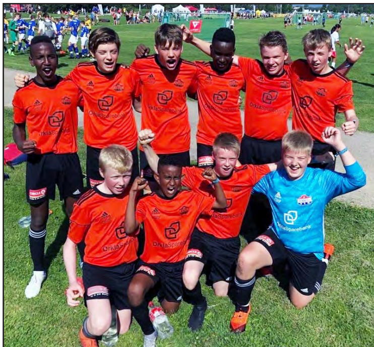
Fotball gutter 14.