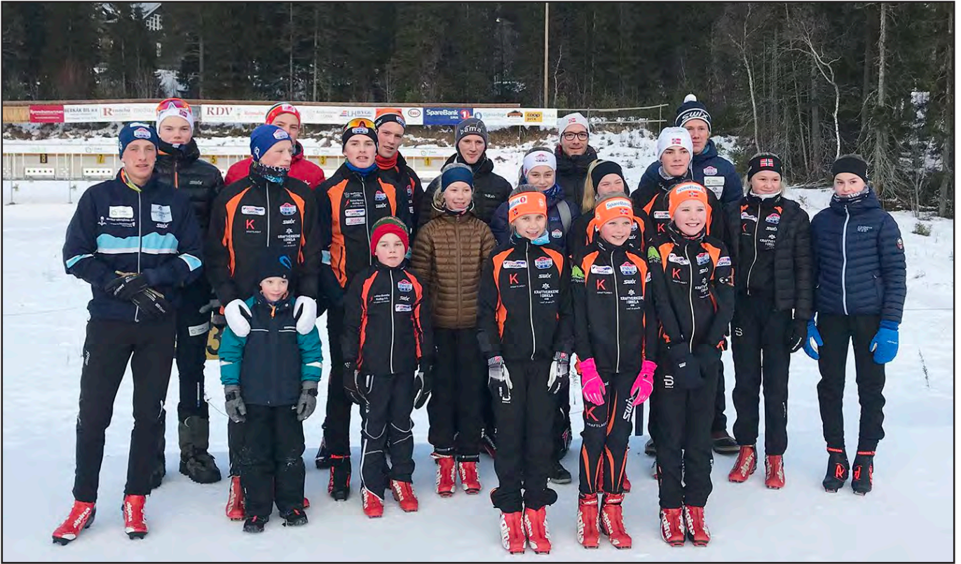
Testrenn på julaften.