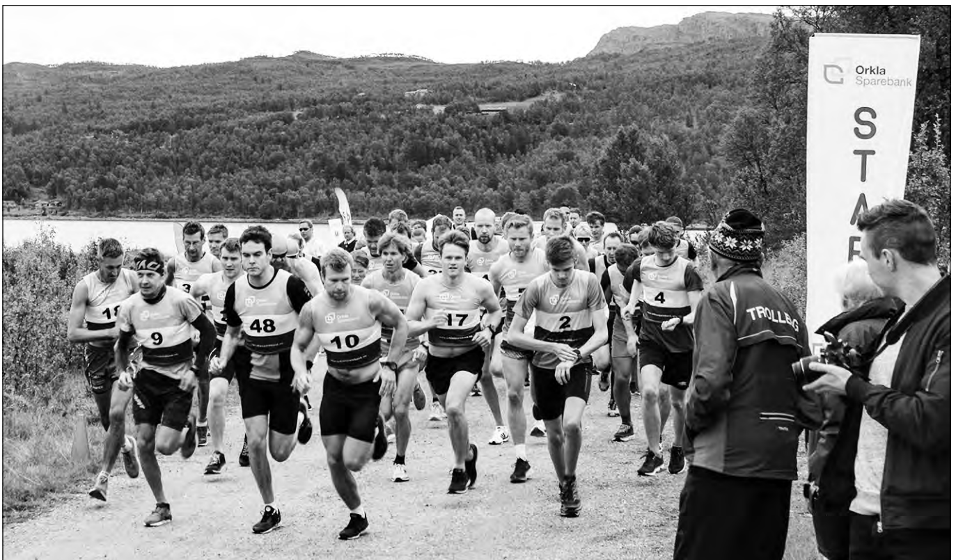
Startfeltet på Nerskogsløpet halvmaraton 2019

Da forhåndspåmeldingen på nettet nærmet seg slutten var vi spente på hvor mange som ville velge vårt arrangement i konkurranse med andre mer veletablerte langløp. Det viste seg at mange løpere hadde lyst til å prøve dette nye løpet i fantastisk fjellnatur på Nerskogen. Det kunne også se ut til at en del lokale sprekinger hadde tørket støvet av joggeskoene.