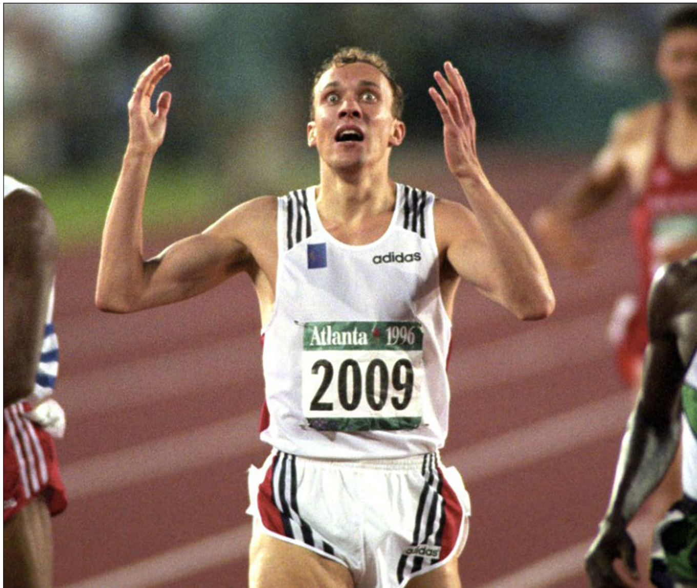
Vebjørn Rodal gjorde det umulige og ble olympisk mester på 800 meter i Atlanta i 1996.

Vebjørn Rodal – han er en av våre og klarte det «umulige».