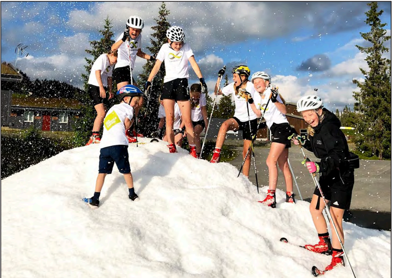
Spennende med snøhaug på Sjusjøen.