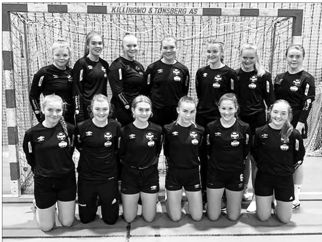
J15 bestod av spillere både fra Rennebu og Meldal.

For laget, oppmann/medhjelper Ragnhild L Øverland