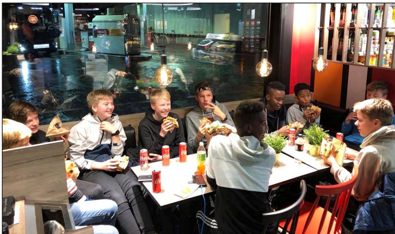
Fotballspillere trenger næring for å kunne yte. Her gutter 14.