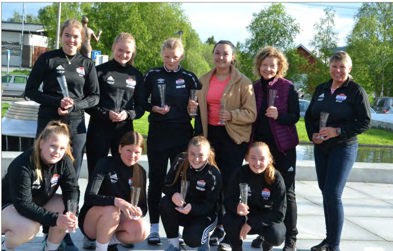
Lagspris 2019 ble utdelt til håndballjentene J14 i forbindelse med årsmøtet i hovedlaget.

Med samhold, innsats og vennskap kommer man langt. Bare spør jentene på håndballaget i Rennebu.