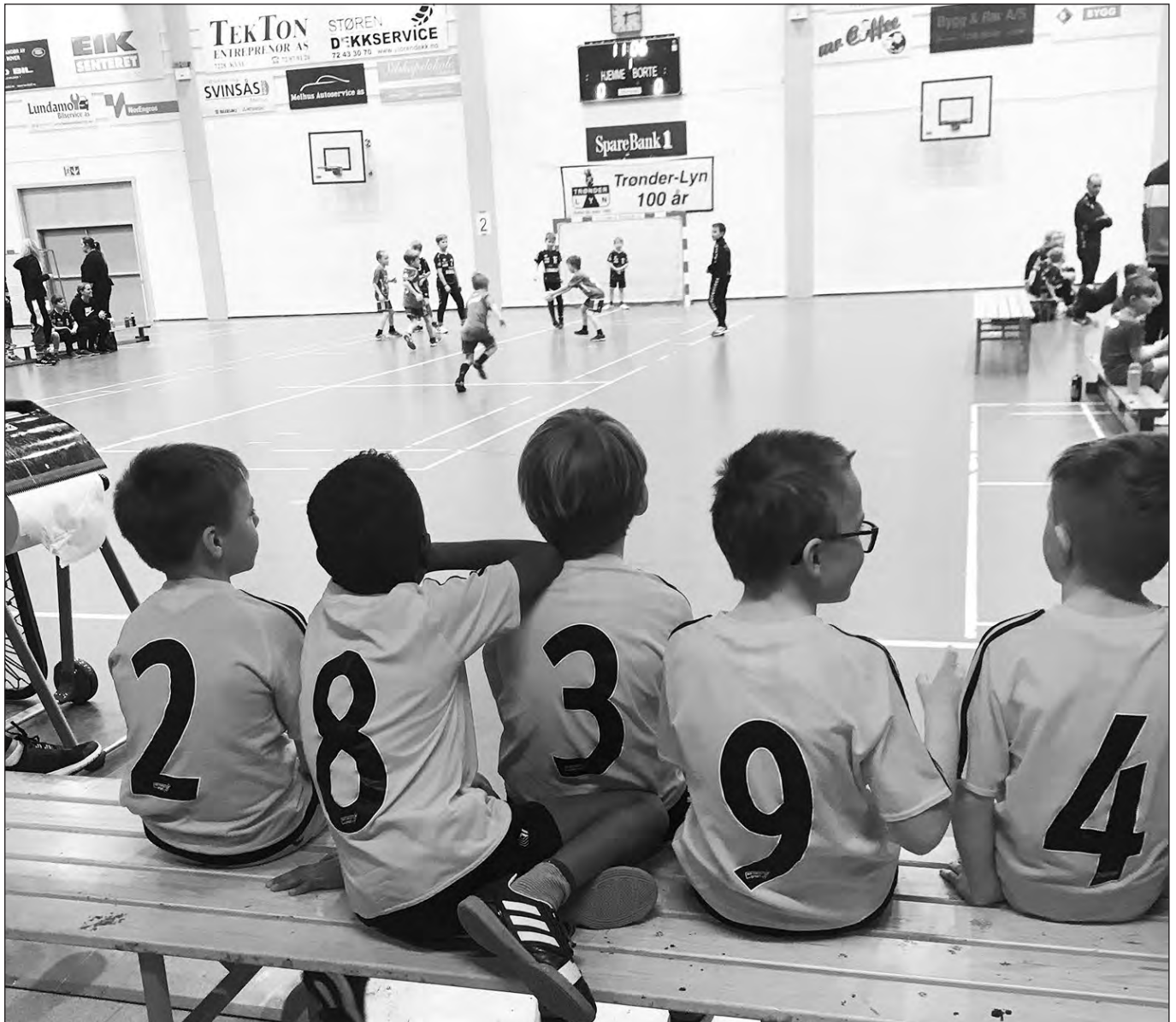
Minhåndball er populært.