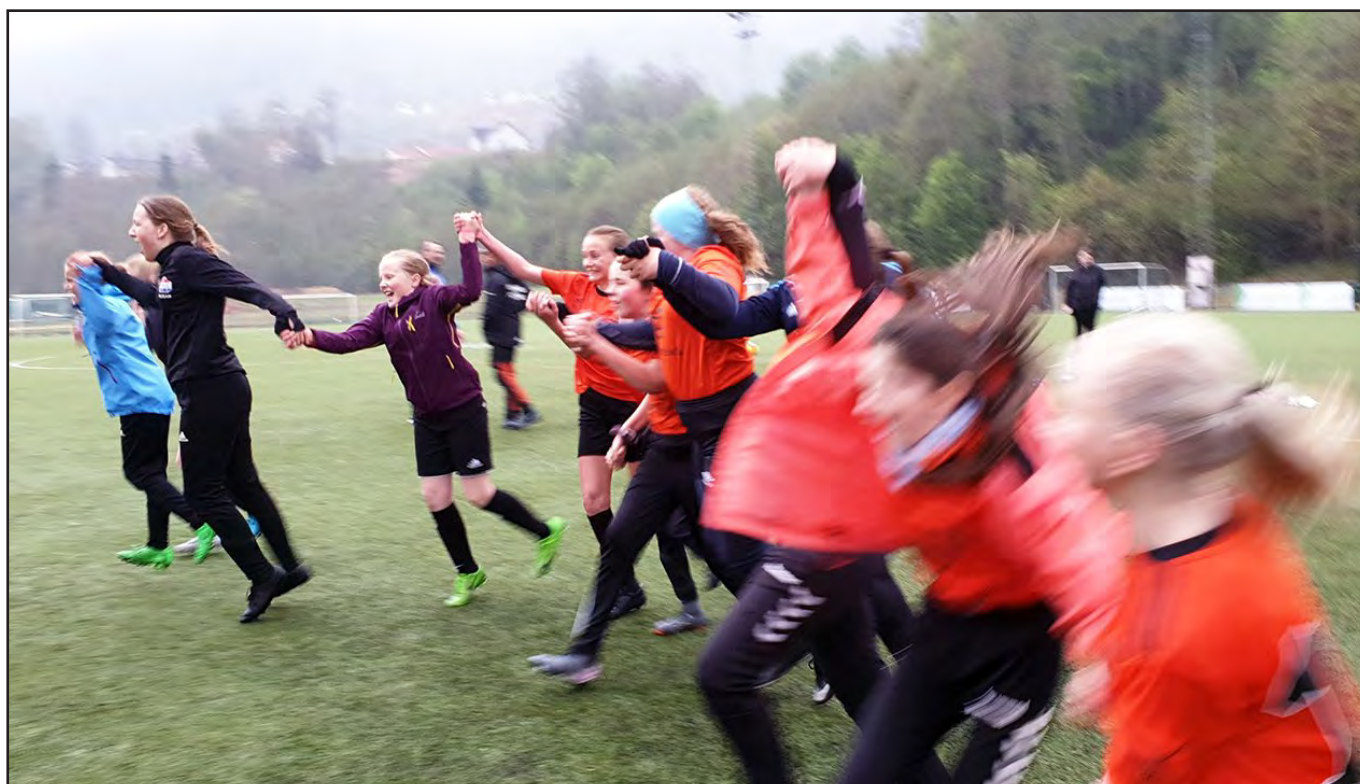
J13 fotball i seiersrus.