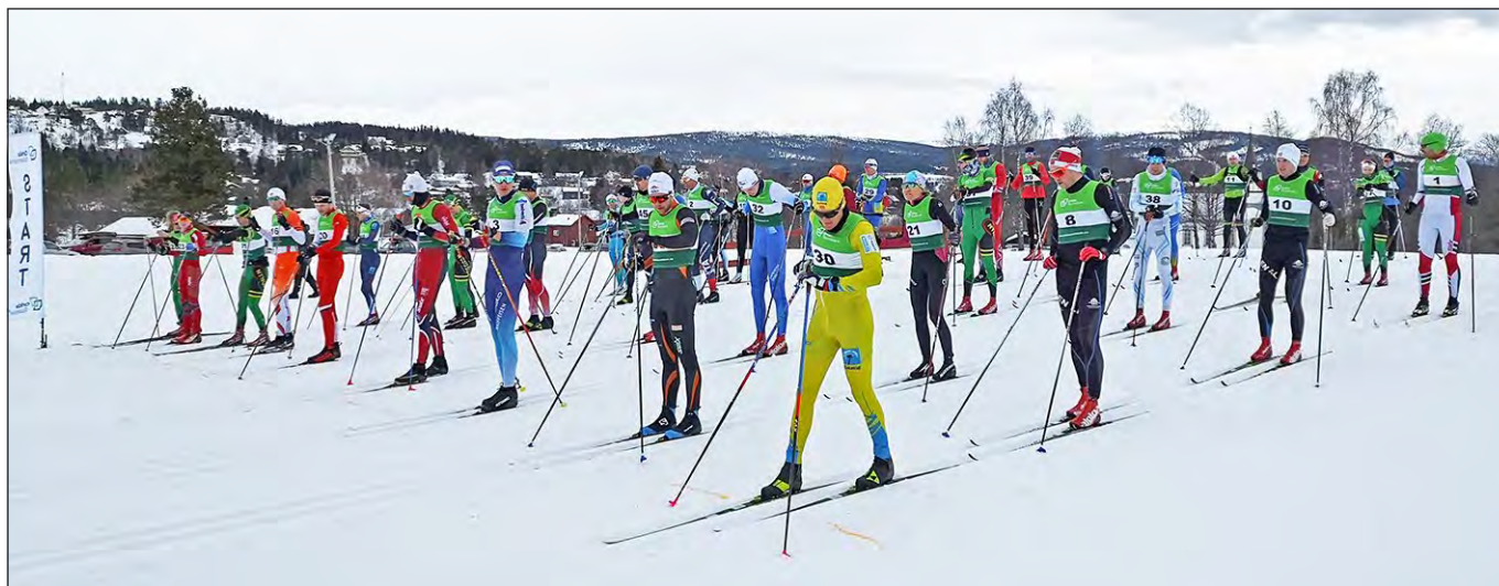
Klar for start under årets Burennet.

Styret i skigruppa ble i 2018 enige om å gjennomføre et 3-årig prosjekt for å igjen etablere Burennet som et viktig arrangement for klubben og for regionen etter noen år med negativ utvikling.