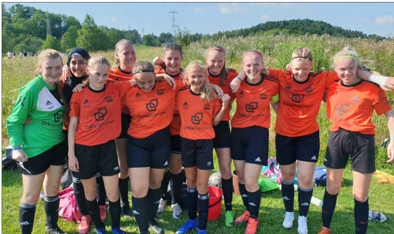
Fotball jenter 17.