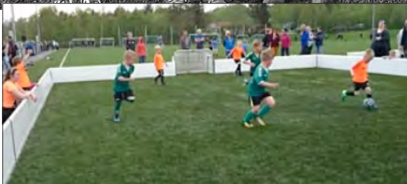
Gutter 2012 spilte 3er-fotball, og er her i kamp mot Sokna.