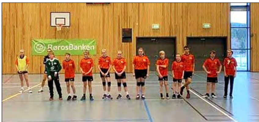
G12 klar til kamp.

Det har vært veldig fin og innholdsrik, men kort sesong med Gutter 12. Gleder oss til fortsettelsen med disse gutta!