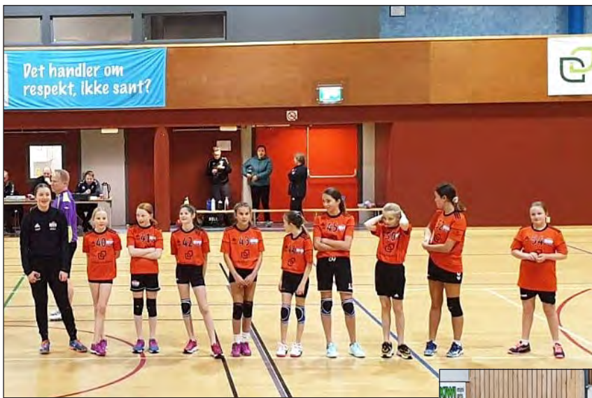
J12 klar til kamp på hjemmebane i Rennebuhallen.