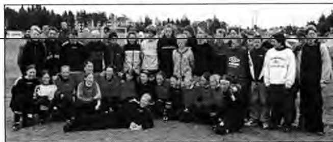
Jentelaget sammen med sine mest ivrige supportere - guttene fra Kolvereid og Inderøy.