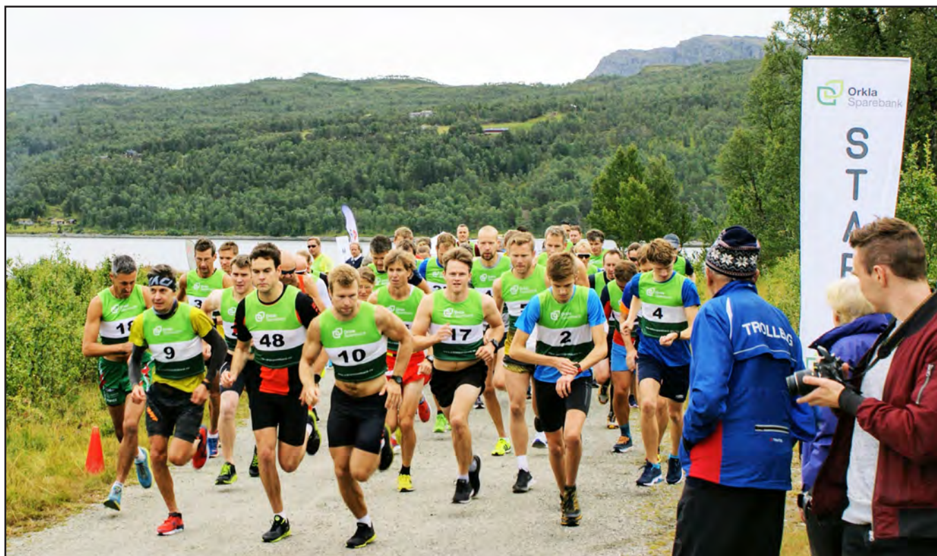
Startfeltet på Nerskogsløpet halvmaraton 2019.