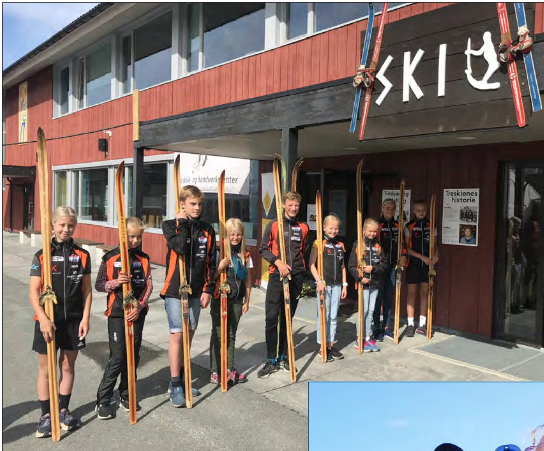
Representanter fra skigruppa under åpninga av skiutstillingen under fjorårets Rennebumartna.