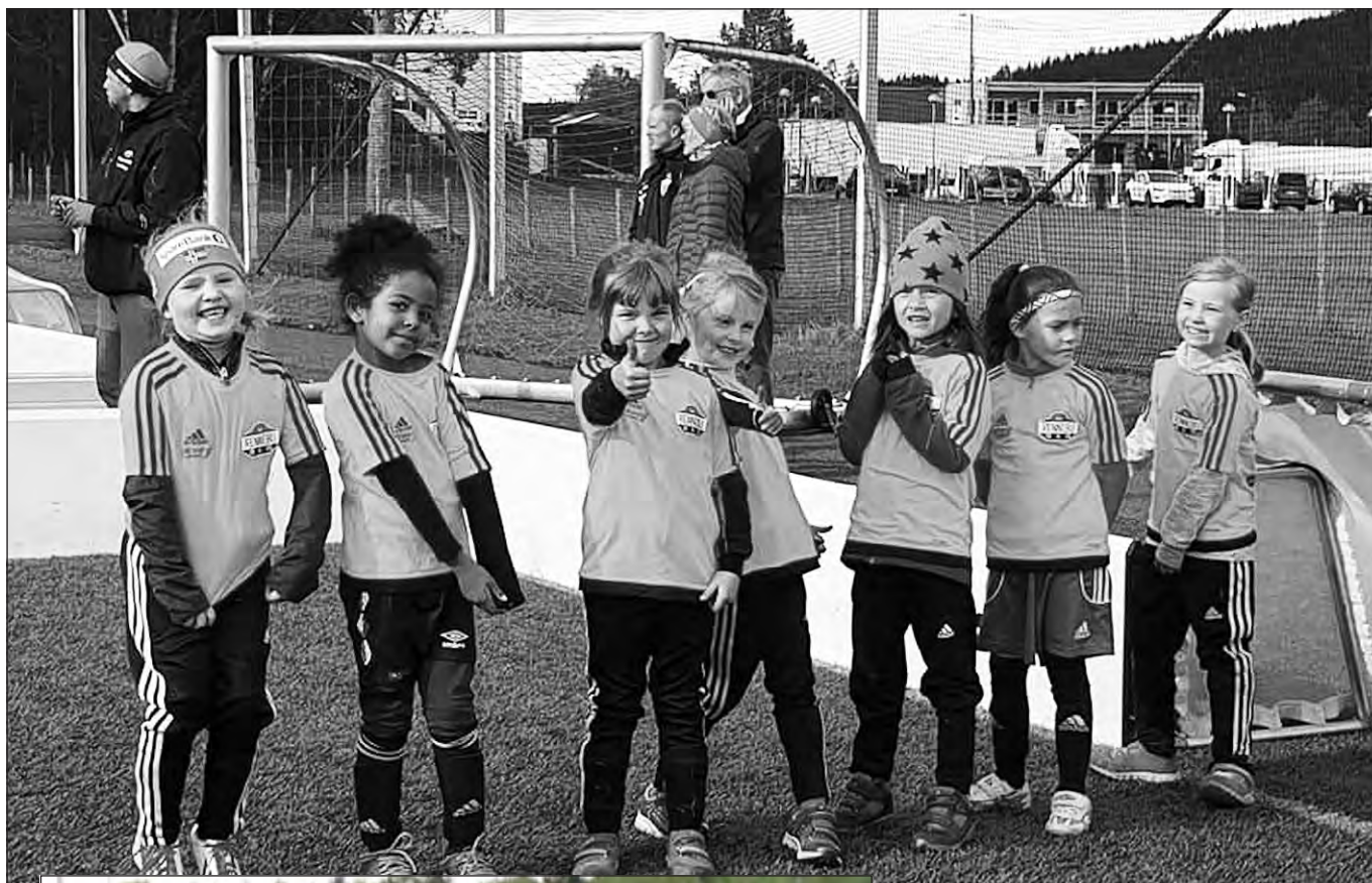
Jenter 8 mini.