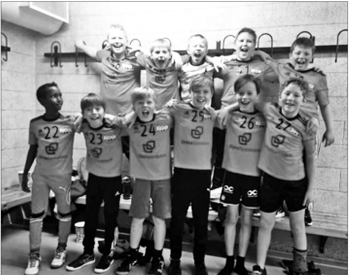
G10 fryder seg over å spille håndball.