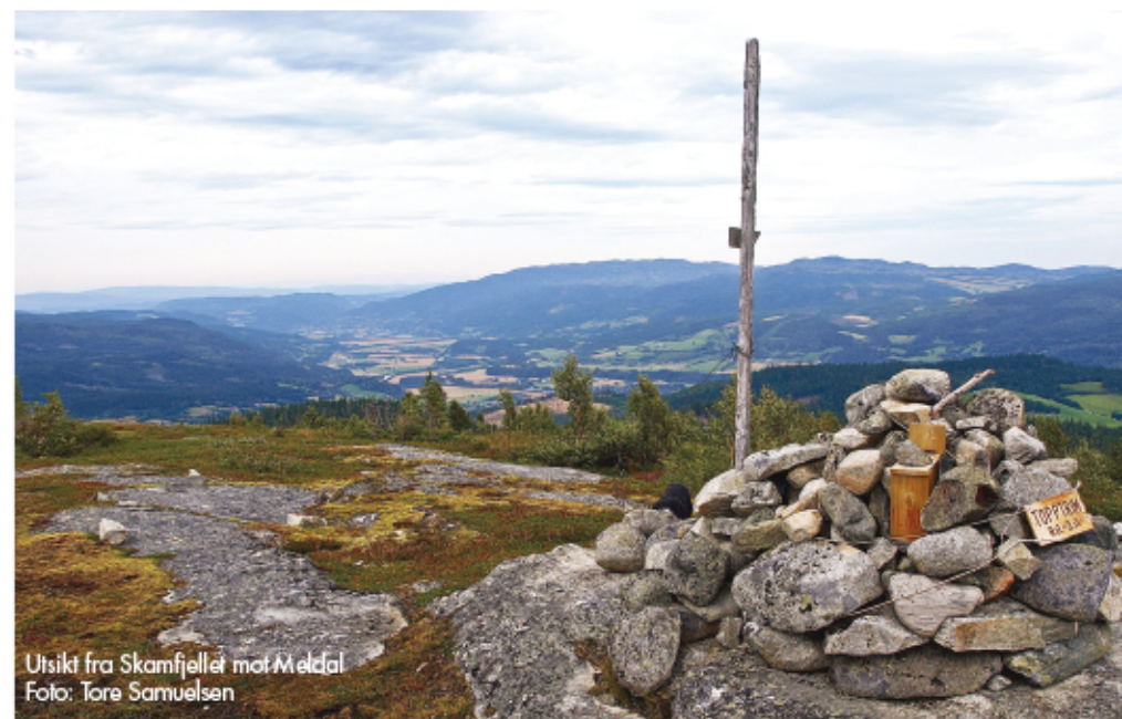
Utsikt fra Skamfjellet mot Meldal

Her har du vakkert fjellterreng – klart til å ta imot deg – fra alle kanter!