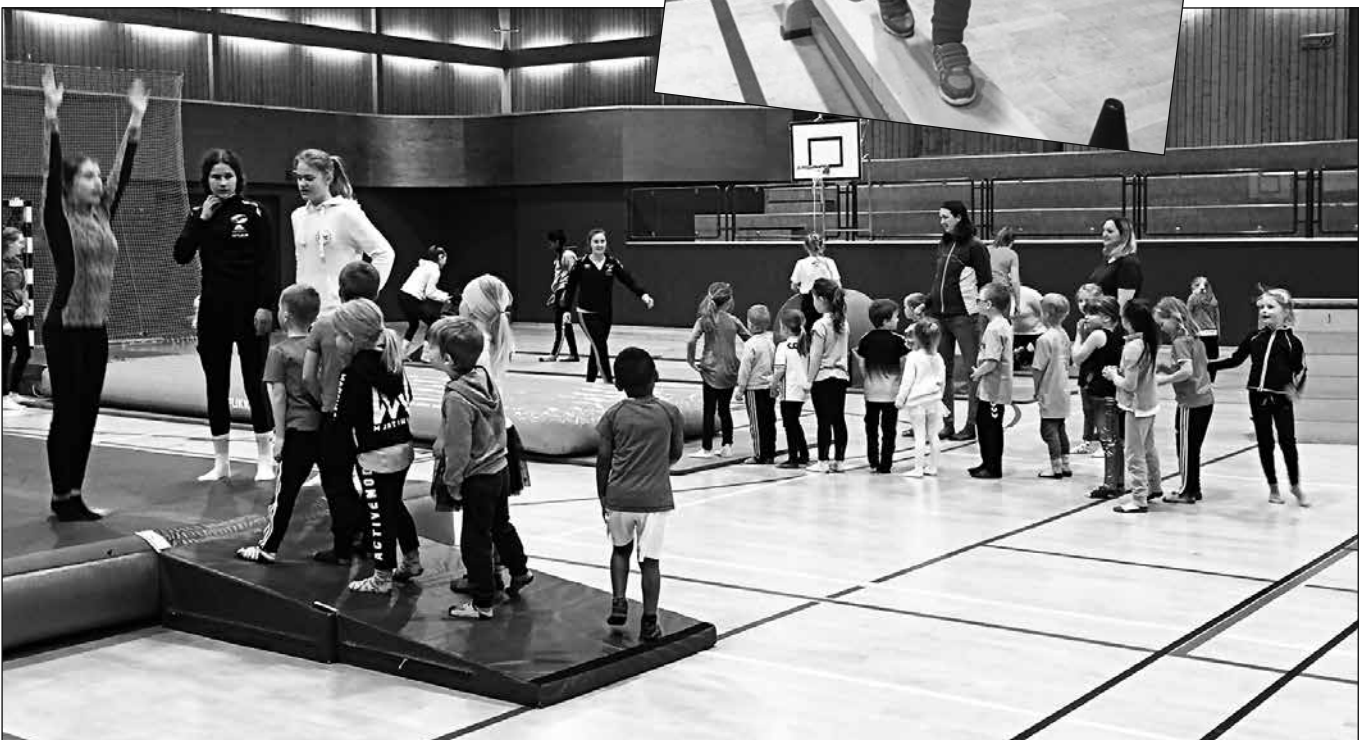
4-6 sport har turn. Dette var gøy!