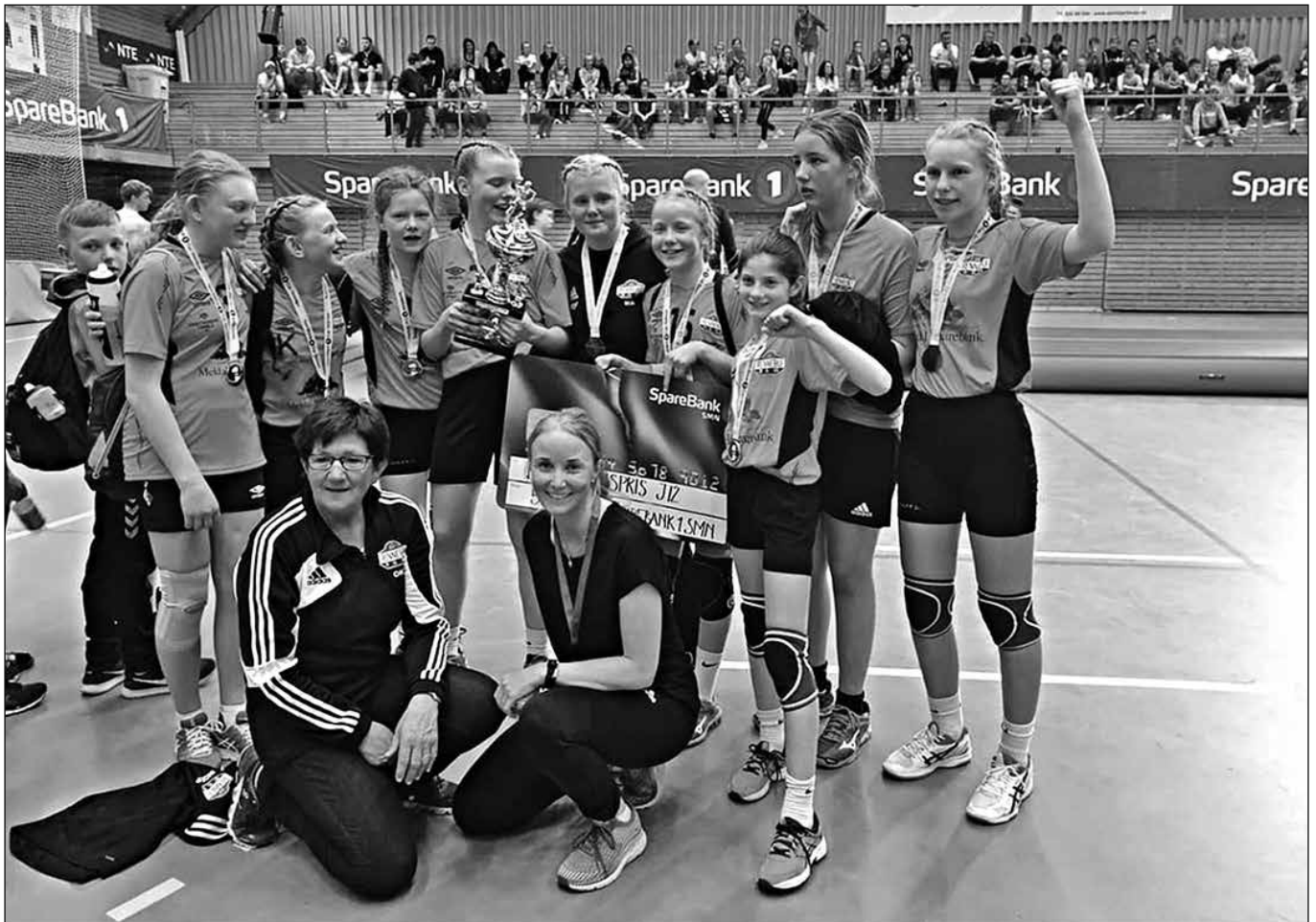
Det ble seier! Stemningen i hallen var helt elektrisk! Sponsorene våre i kraftmarkedet var til stede for å si det sånn...! Gratulerer til spillere og trenere: