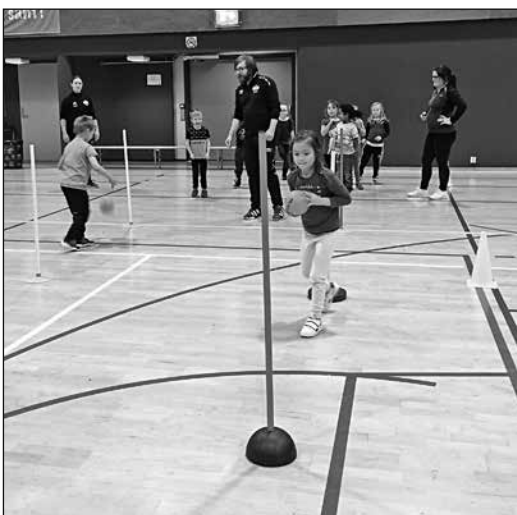
Full fart med stafett