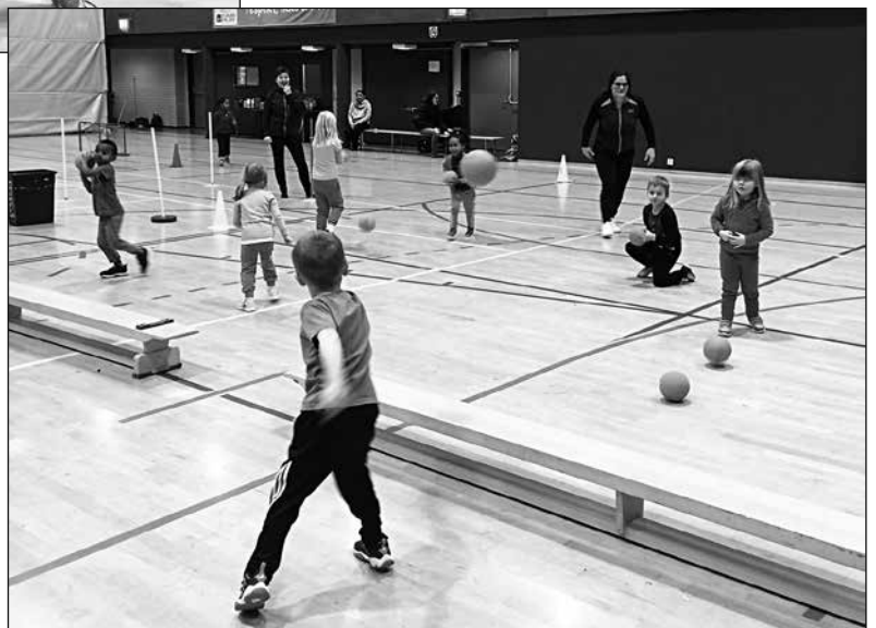
4-6 sport har ballek