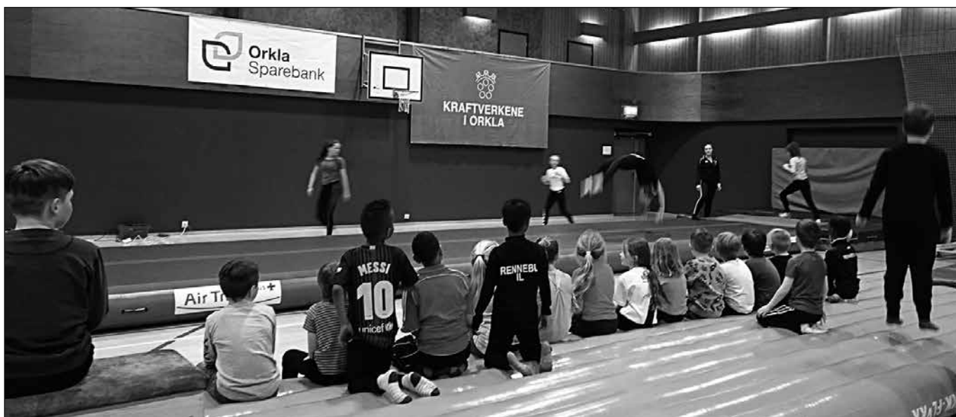
Imponerte barn ser på instruktørene i turngruppa som hadde en liten oppvisning helt på slutten av koelden