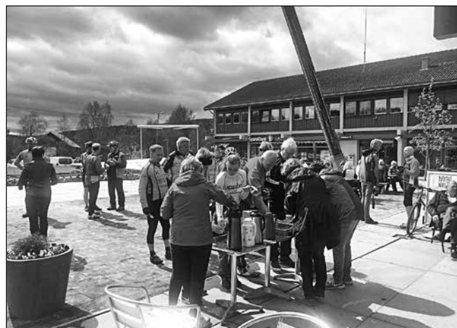
Folk koste seg på torget etter sykkelturen