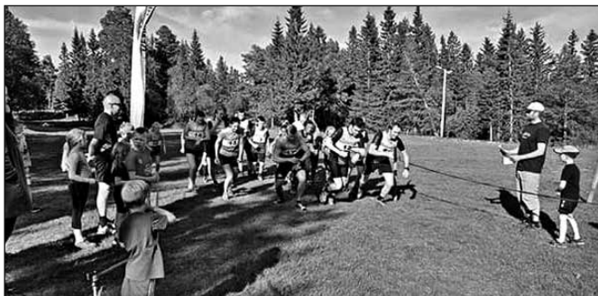
Startfeltet i Mjuken Opp 2018