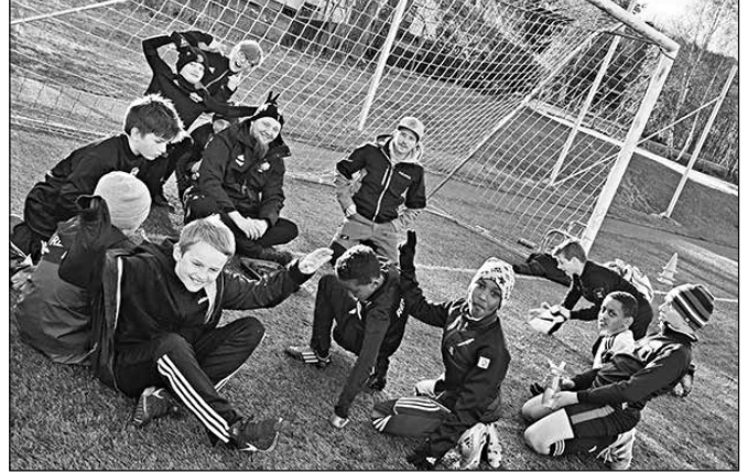
Gutter 2008: Gode treninger med godt humør