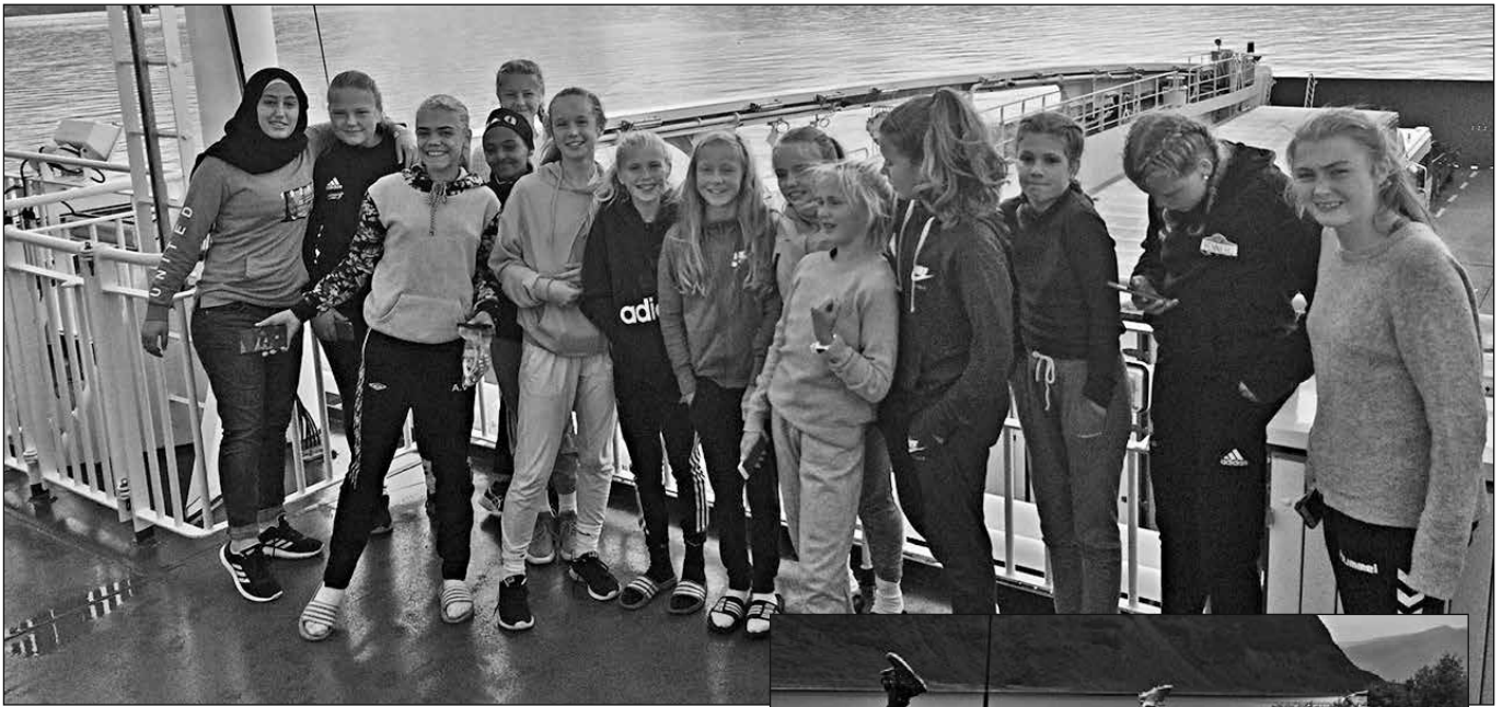
J14 på Hessacup 2018.