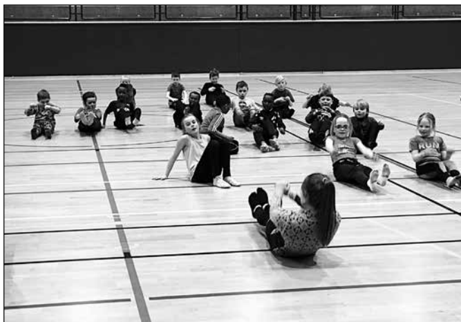
Oppvarming før turn