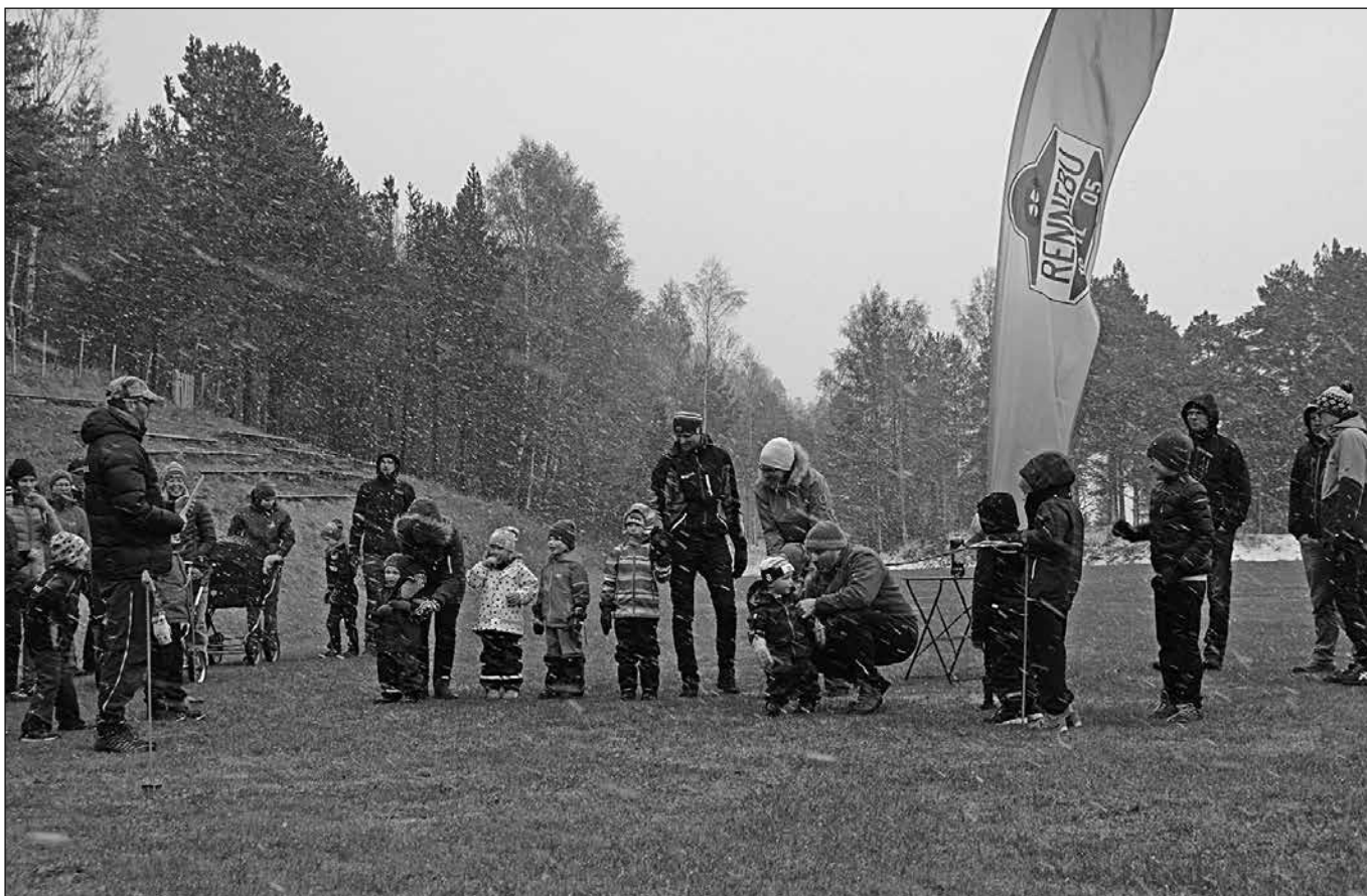
Det var tett snøvær da første terrengløp ble arrangert på Frambanen 2. mai.