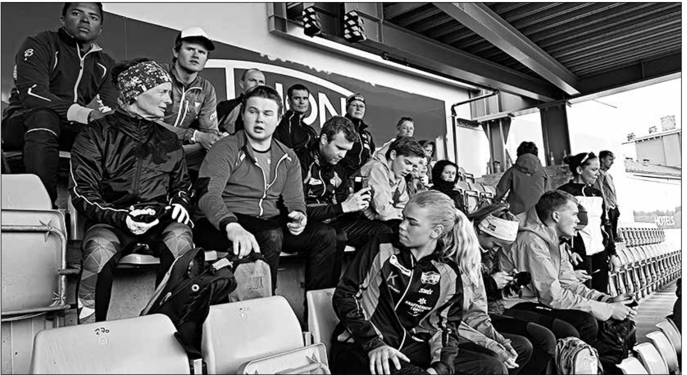
Gjengen samlet på Bislet før start.