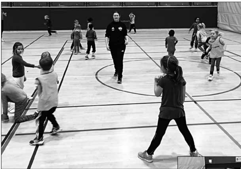
Stiv heks er en populær oppvarmingsøvelse på 4-6 sport