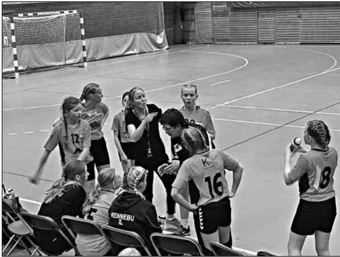
J12 Steinkjercup. Peptalk i pausen under J12-finalen! Stor spenning og en enda større opplevelse...