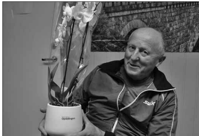
En verdig mottaker av Opdalings Ukens blomst

- De trenger pengene mer enn meg. Jeg vet hvor