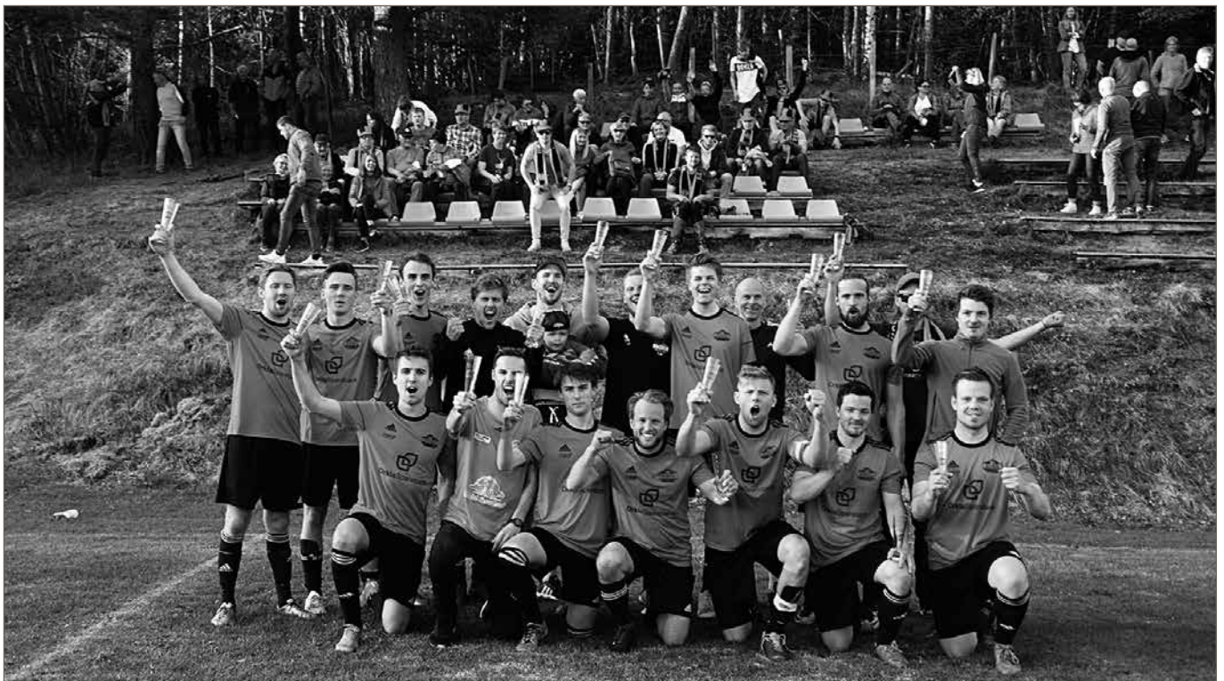
Lagspris 2018 ble utdelt til A-laget 16. mai 2019. De spilte da mot Sverresborg og vant 1-0.

I siste serierunde, i det som egentlig var en kamp uten betydning, leverte Rennebu et fyrverkeri av en kamp, og avsluttet oppholdet i 5. divisjon med å slå Leik 9-2 på Hølonde. Bare så det er nevnt.