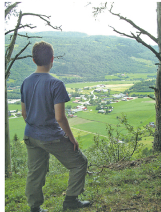
Vollagrenda sett fra Osphaugen.

som skal ha funnet sted for omtrent 1000 år siden. Der Pilegrimsleia møter Hurundsjøveien ser du to hauger. Sagn sier at dette er gamle gravhauger fra førkristen tid. Følg Hurundsjøveien ned til Rv 700 ved Voll og Rennebu hovedkirke.