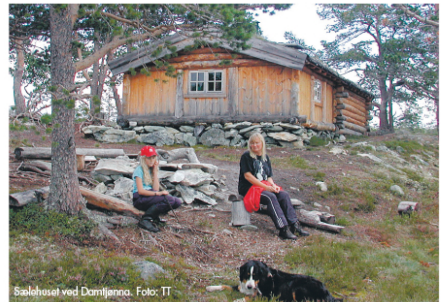
Sælehuset ved Damtjønna.