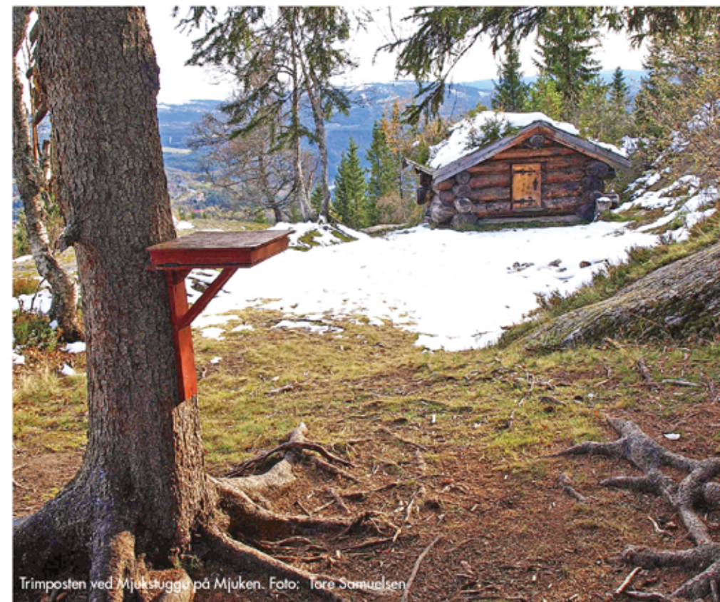
Trimposten ved Mjukstuggu på Mjuken.

Det er bratt stigning opp til Mjuken. Herfra blir det flatere terreng mot Risknappen (781 moh.). Stien går gjennom myrlandt og til dels bløtt terreng. Fra Risknappen er det flott utsikt i alle retninger mot Ilfjellet, Trollheimen og Forollhogna nasjonalpark i retning øst. Nedstigninga går mot Bjørnberget og videre ned i Bredalen og langs skiløypetraseen tilbake til Berkåk.